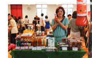
地元契約農家のオーガニック野菜など、こだわり素材で手作りする無添加調味料やドレッシングの「Lohastyle」。万葉しょうゆタレ(860円)やじんじん野菜ドレッシング(600円)は必ず買いたい定番商品。URL: http://www.lohastyle.co.jp/