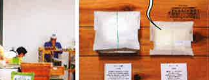
男性にも人気のミントソープ1300円

無農薬のローズとドクダミにヒアロロン酸入りのローズ・ドクダミローション5940円