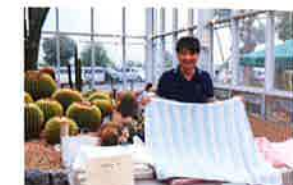
伝統的な三河木綿の産地、蒲郡市の「市川織布工場」。厳選した糸と5層のガーゼ生地を織り上げるガーゼケットや、K's GARDEN CAFEのテラスでも使用される日よけシェード(8000円〜)を販売。URL: http://fchiori.com/