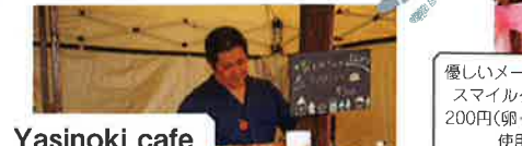
元パティシエのりゅうおさんと、元フーリストでロザフィ作家のおりひめさん

りよくちのりゅうこうえん ● 日本一の抹茶産地・西尾市で唯一のエコファーマー認定農家。有機肥料のみで自然の草と共生して作るお茶は、体が喜ぶ風味豊かな味。URL: http://blog.livedoor.jp/ryukoen/