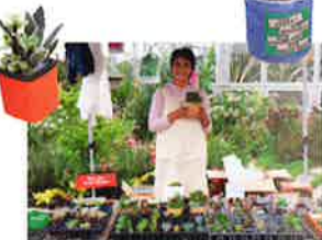
「根室園芸」の多肉植物は缶鉢付きで500円。鉢なしなら5株で300円とお得!