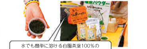
水でも簡単に溶ける自煎茶葉100%の碾茶パウダー1800円。花粉症の愛飲者も多い