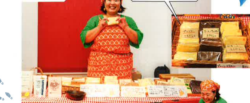
20センチのシフォン型を10等分にして販売(1個260円〜)。醒香園の無農薬抹茶や伊予相模入りなどが人気