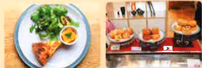
イングリッシュスープに野菜のキッシュがセット1380円

「安く消費するのがあたりまえの現代。マルシェと公園全体を通して、本当に価値あるものは何なのかを次世代へ発信していきたいと思っています」。