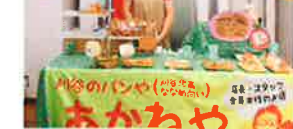
刈谷市にある手作りパンとそうざいの「あかねや」。よさみ特製のアンパン(240円)や食パンマンマンラスク(60円)は子どもにも大人気! URL: http://akaneyadayori.blog.fc2.com/