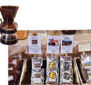
名古屋市北区の自家焙煎ビーンズショップ「PANDA COFFEE ROASTER」も出店。ここでしか買えないよさみブレンド(200g1180円)ほかオリジナルブレンド豆を販売。淹れたての香りとうれしい試飲サービスもついでに。URL: http://pandacoffee.com/