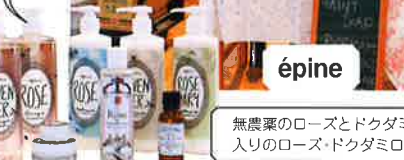
無農薬のオールドローズ油を原料にしたローズシャンプー3500円