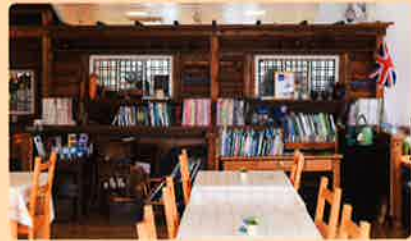
イギリスのアンティーク小物などを飾った居心地のいい空間